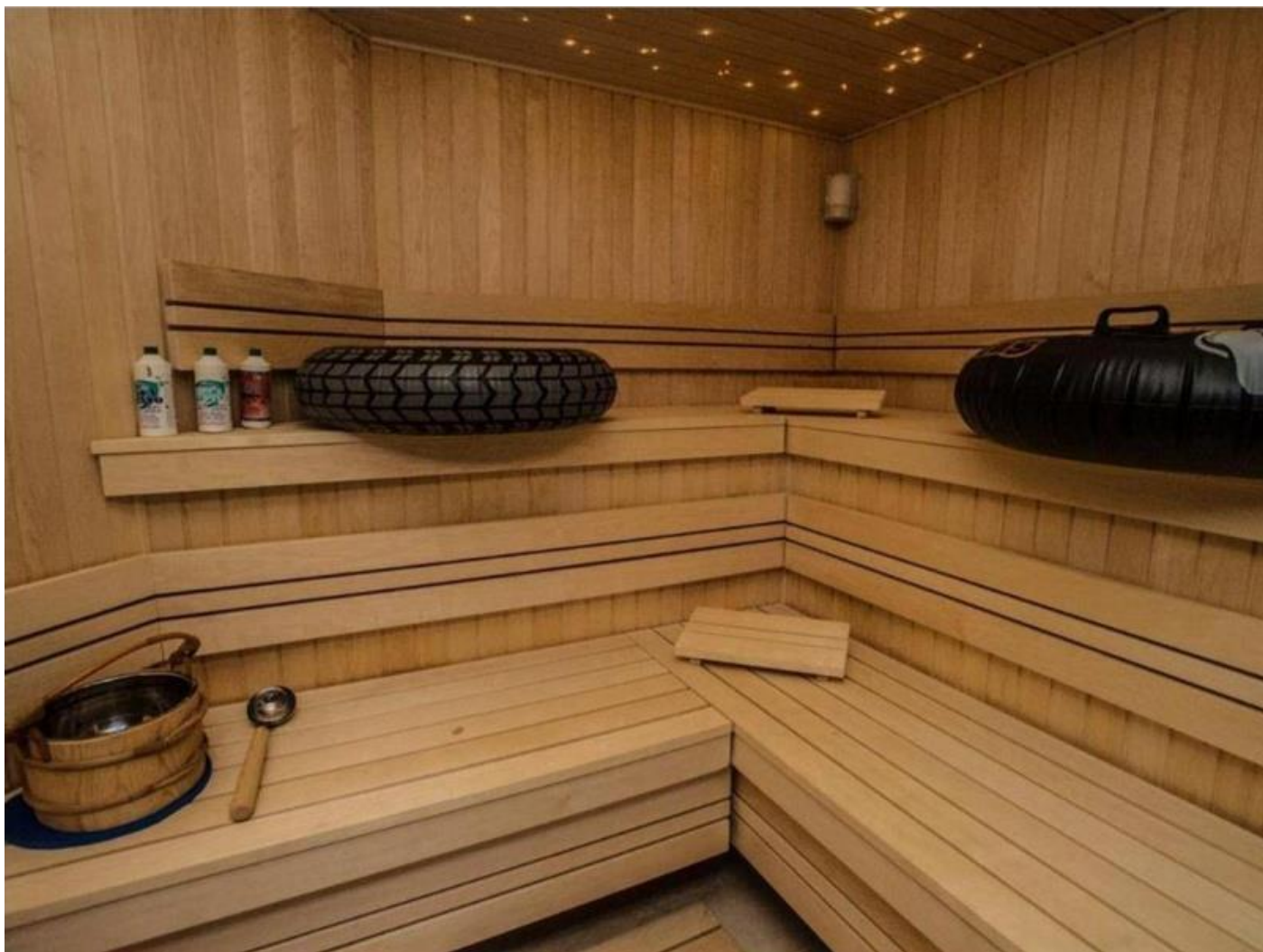
Sauna taky ne.