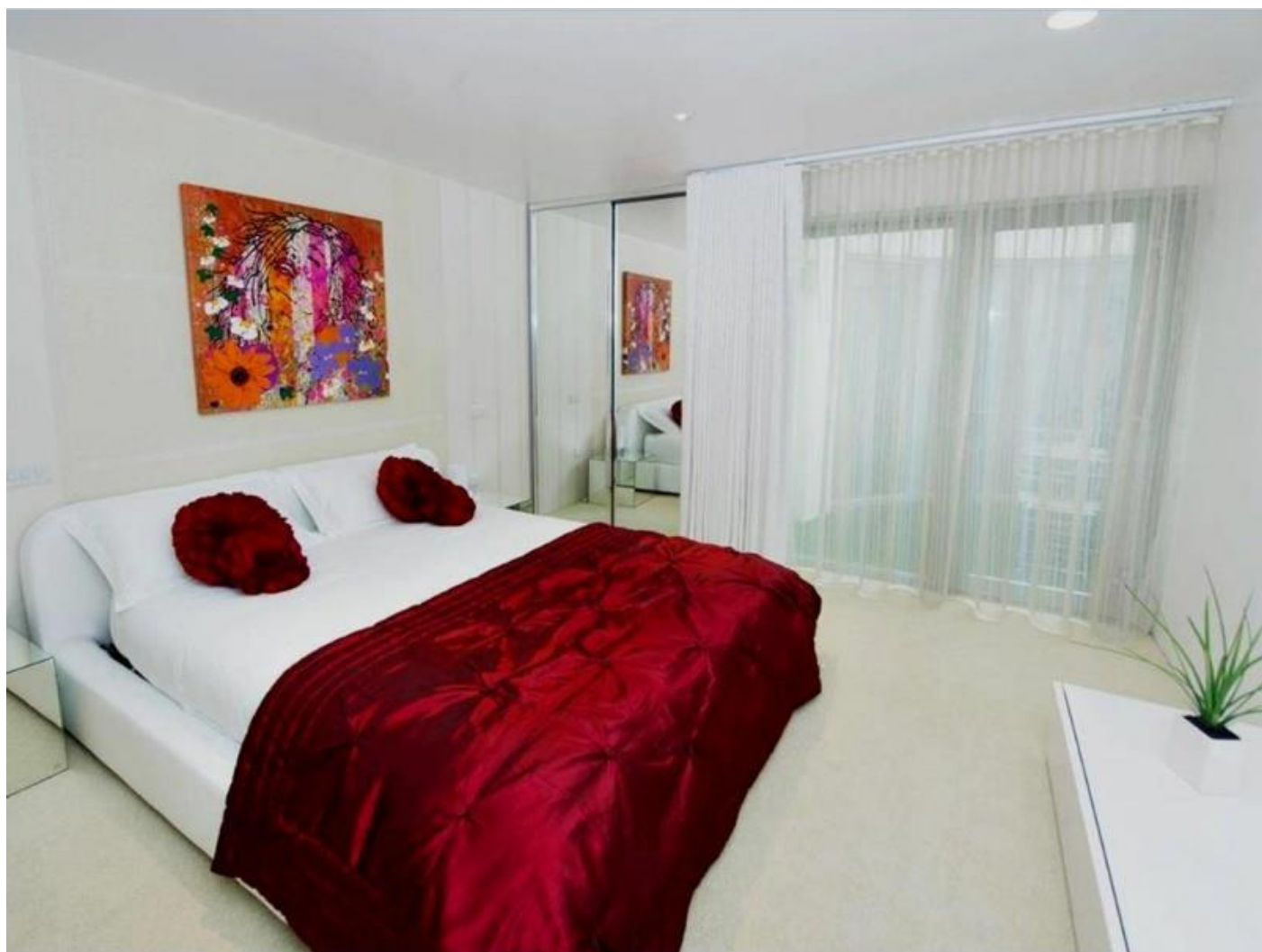
Zařizeno pro kvalitní spánek a sex.