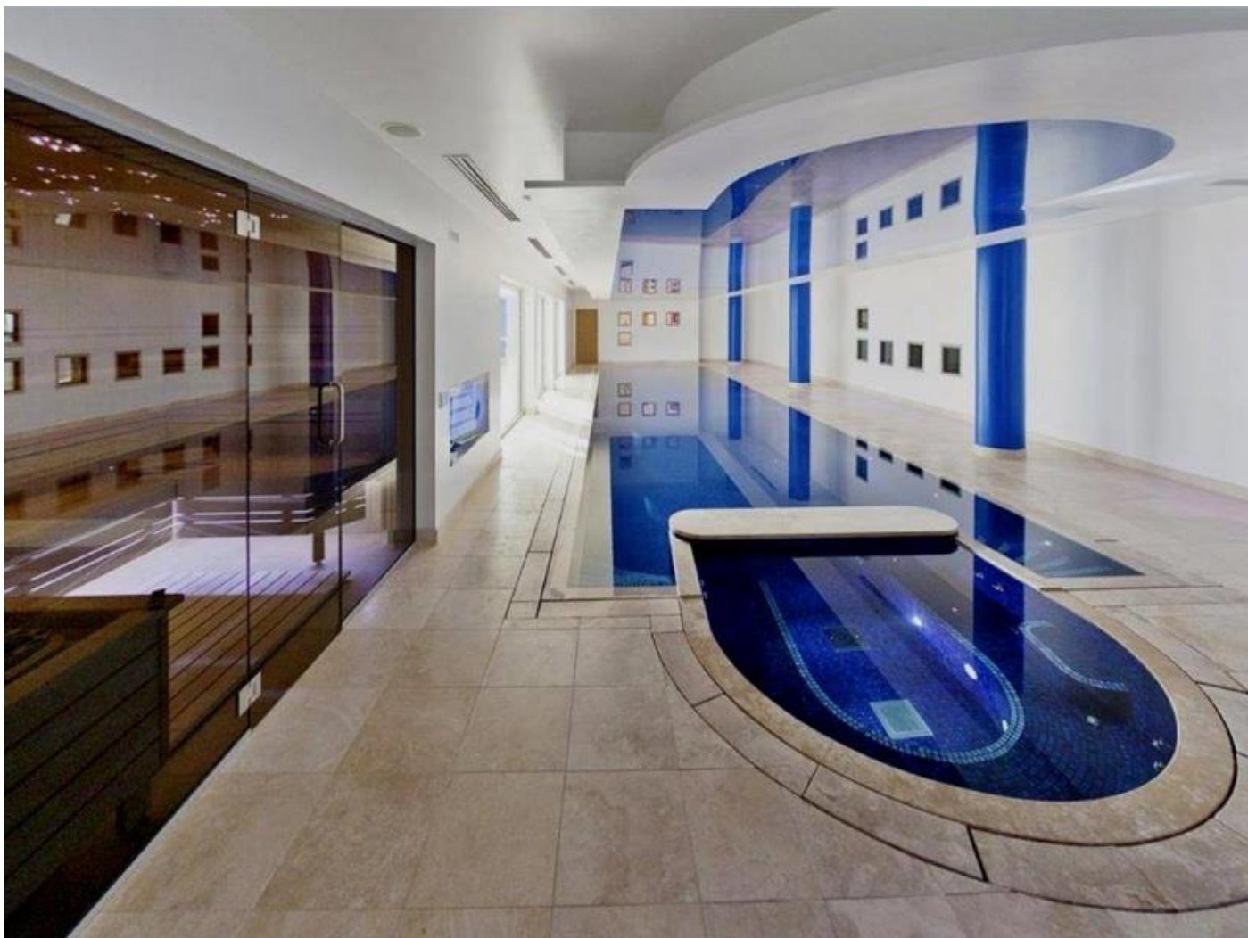
Bazén nesmí chybět.