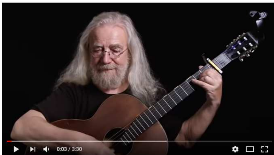
Jaroslav Hutka: Miloš a zubatá (2018)

k fyzickému útoku na prezidenta republiky, aby mu někdo rozbil hlavu. Skutečnost, že nahrávku poskytla k volnému šíření zdarma na internetu právě nezisková organizace spolupracující s médii veřejné služby, představuje hrozbu pro demokratické principy v České republice, minimálně to, co z nich ještě zůstalo.