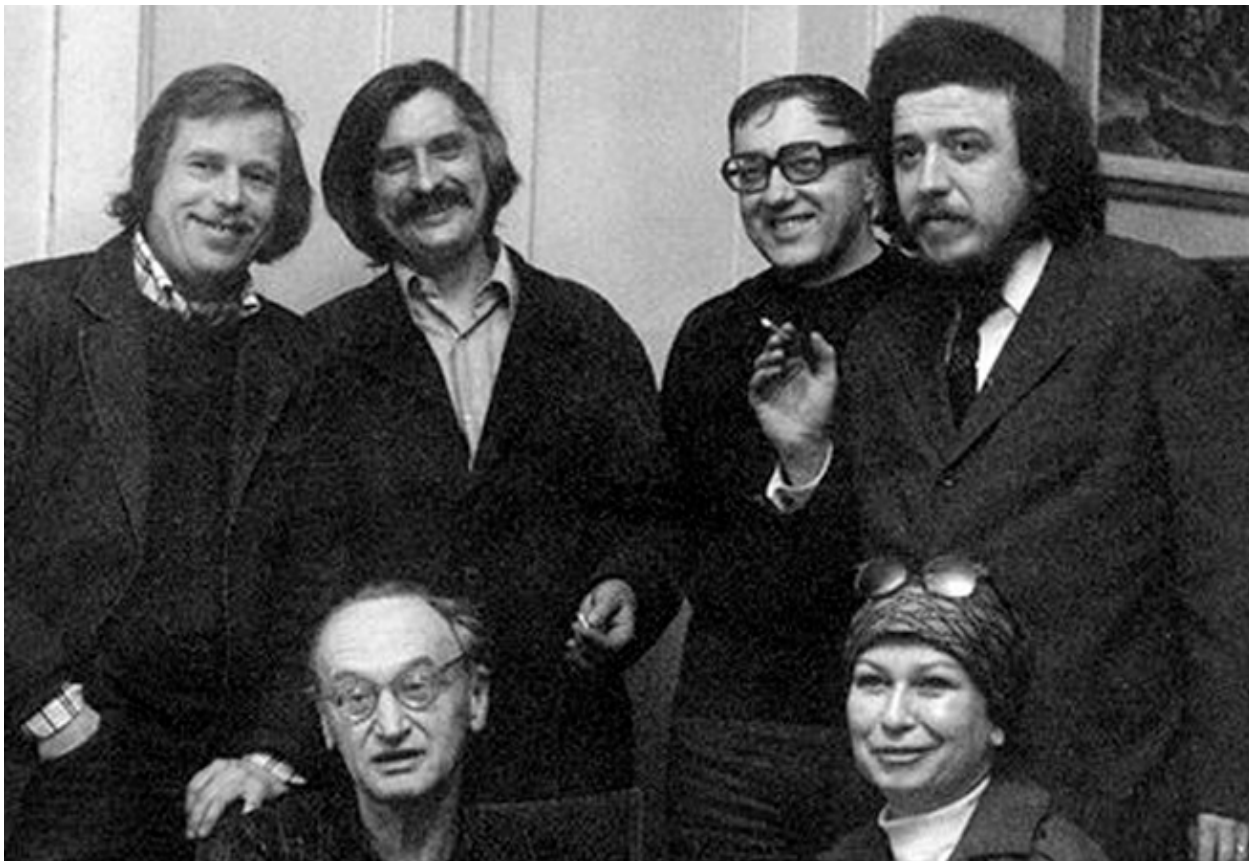
Momentka z disentu

6) Zřetelnou součástí těchto dohod byla ujednání o využití komunistických oligarchií k udržení pořádku a k zachování vlivu komunistického mezinárodního hnutí v mocenských strukturách po převratech. K tomu účelu vznikla kooperace mezi KGB a CIA, jejichž společné komise převraty řídily a schvalovaly personální sestavy nových vlád. Mocenskou stabilitu během změn probíhajících ve východní Evropě zajišťovaly všude armádní složky řízené sovětským GRU, rozvědkou generálního štábu Rudé armády.