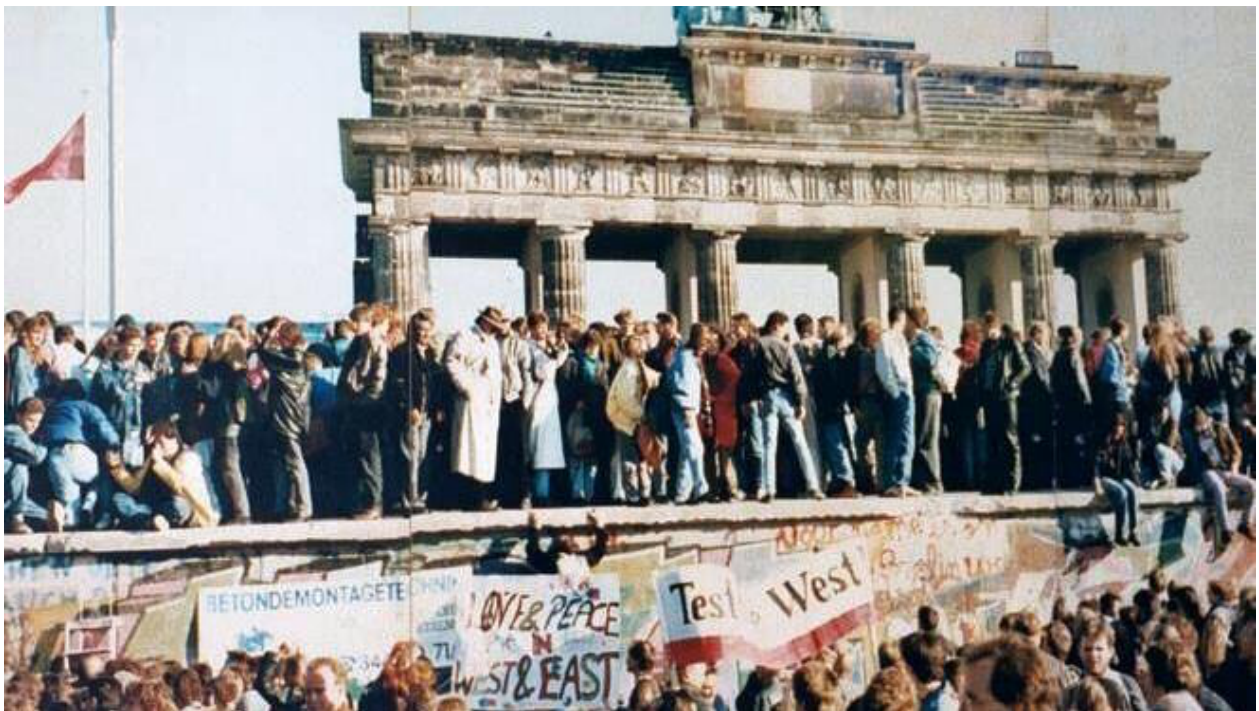
Pád Berlínské zdi

1) K převratům došlo ve všech komunistických státech Evropy synchronizovaně v průběhu 7 měsíců. Z hlediska sociologického a psychologického je vyloučeno, aby tyto převraty byly uskutečněny spontánně, neorganizovaným, dezorientovaným a víceméně loajálním obyvatelstvem , proti téměř neomezené moci komunistických vlád těchto zemí, zajišťovaných vojensky a bezpečnostně druhou největší mocností světa – SSSR, jejíž síla nebyla otřesena.