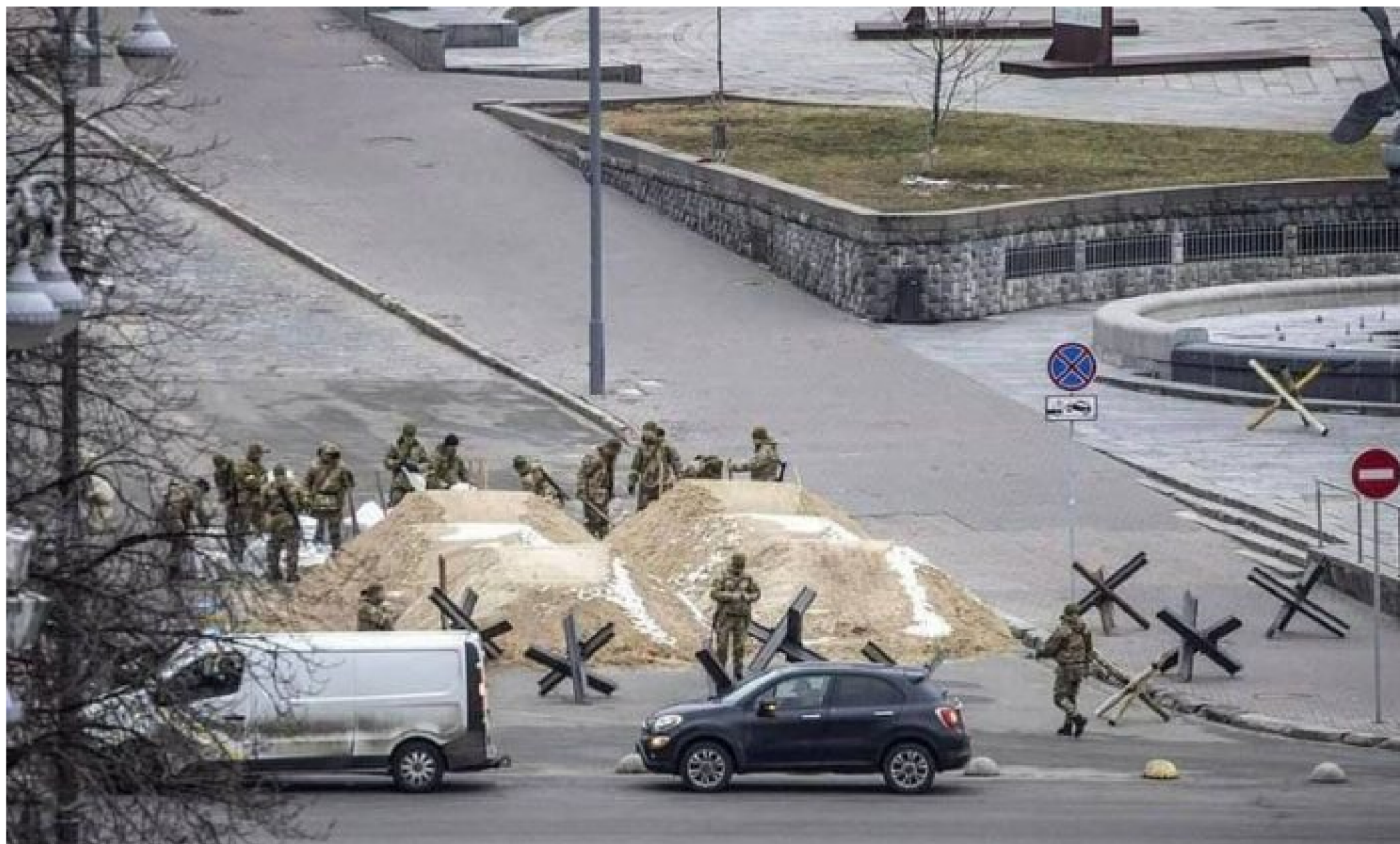
Ukrajinské oddíly SBU budují barikády v ulicích Kyjeva, 3. března 2022

Dům Sion se chce za každou cenu dostat k obrovským zdrojům Ruska. O nic jiného vlastně vůbec nejde. Dříve to byl Napoleon a jeho vojska, potom Lenin a Trockisté, potom Hitler a jeho Wehrmacht a nakonec v 90. letech soliterně Američané, které ale v roce 1999 odstavil a vyšplouchl Ruský židovský kongres, který dosadil do křesla prezidenta Vladimira Putina, bývalého důstojníka KGB, který Američany uctivě, ale se vší razanci z Ruska vypoklonkoval.