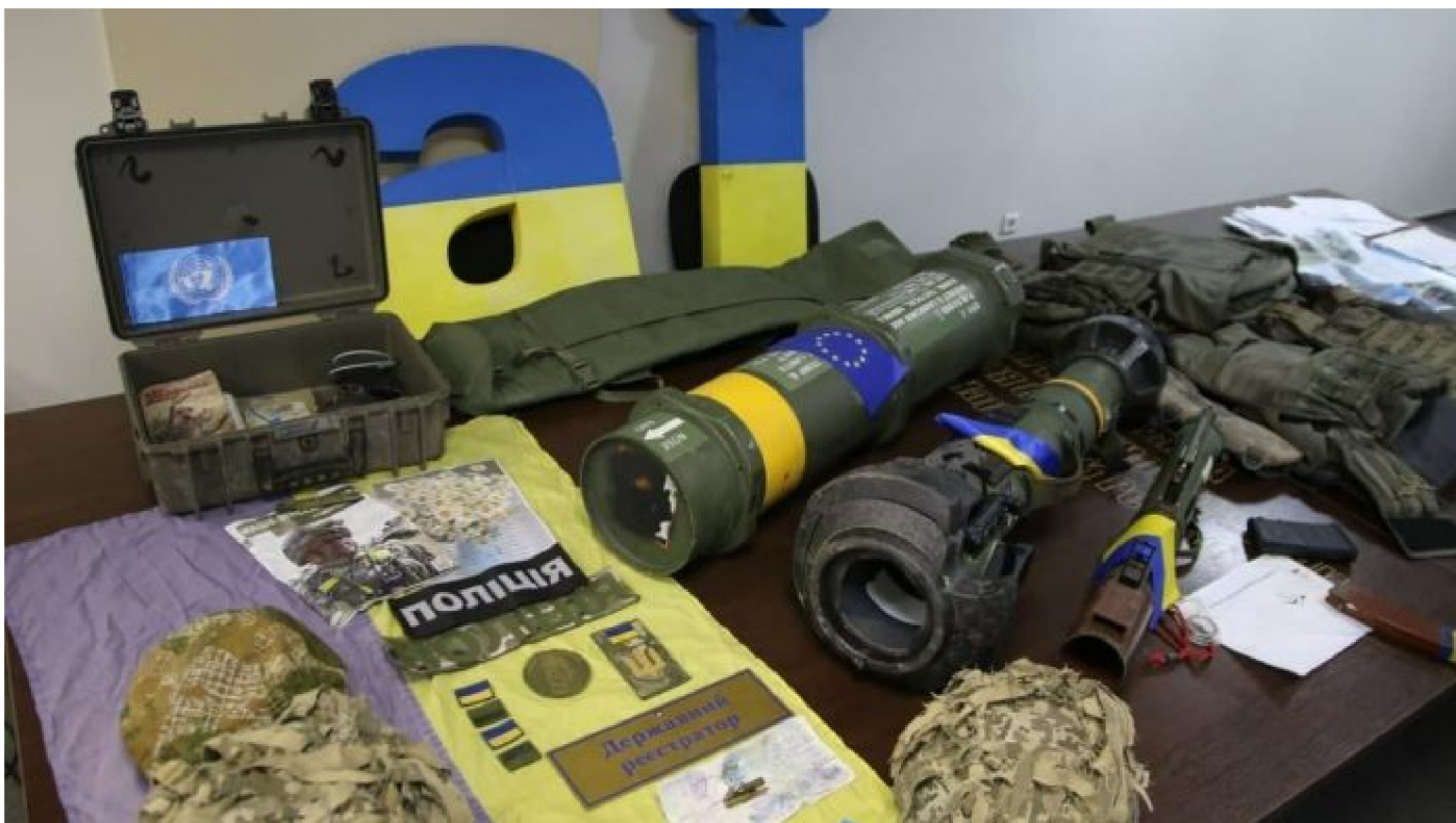
Jednotky DLR ukázaly ukořistěnou výstroj a výzbroj ukrajinské armády, kterou našli na opuštěných pozicích

Všichni jako by zapomněli, že Rusko je jaderná velmoc a že 30 let rozšiřování NATO a přibližování k hranicím Ruska nebude tolerováno donekonečna. Naprosto opovrhují českými mainstreamovými médii, které štvou české občany do války proti Rusku, protože jediné dva termonukleární údery strategickými hlavicemi v případě 3. světové války vymažou Čechy i Moravu ze zemského povrchu. A nezůstalo by jen u dvou úderů, na Česko by dopadly desítky, ne-li stovky hlavic, od těch taktických, až po strategické.