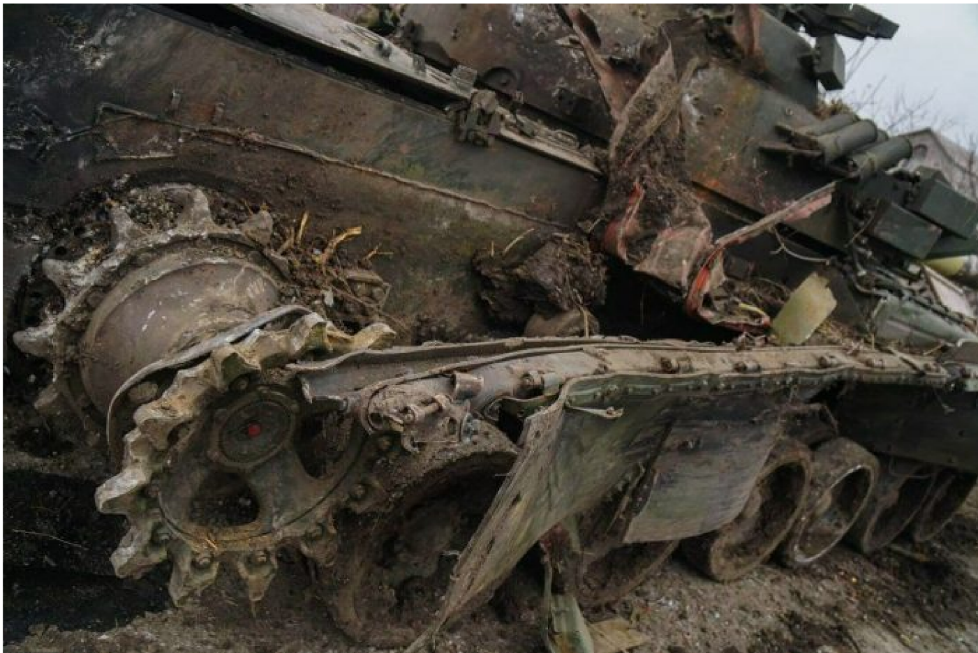
Detail zničeného náhonu ukrajinského tanku

Bez Ruska nebude mír v Evropě, bez Ruska nebude bezpečnost v Evropě, bez Ruska nebude ani plyn, ani ropa. Ta bude jen pro vyvolené, bude to exkluzivita pro elity. Pokud Evropa odmítne Rusku garantovat bezpečnostní rámce, Evropa to nepřežije a všichni skončíme v termonukleárním ohni III. sv. války. Stejně tak, jako USA by neakceptovaly a nikdy nepřijaly rozšíření Varšavské smlouvy k prahům své země na Kubě, tak stejně i opačně Rusko nikdy nedovolí Ukrajině vstupu do NATO , a to ani za cenu použití jaderných zbraní, stejně jako k tomu byl odhodlán J. F. Kennedy během Karibské krize.