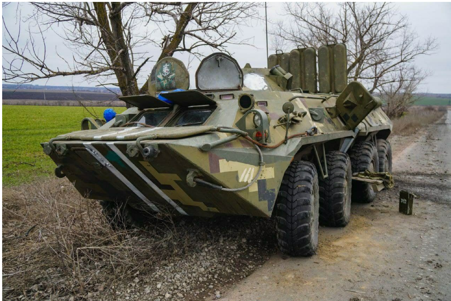
A znovu další opuštěná ukrajinská technika, tentokrát BTR

bortí, volají do zbraně, do semknutí, volají po zákazu Aeronetu. Každé impérium má stejný konec, nakonec se zhroutí na tom, na čem impérium původně vzniklo, na svobodě, spravedlnosti a ideálech. Postupně totiž každé impérium začne lidem tyto 3 pilíře odpírat, odebírat, podkopávat. Tím si ale říše podkopává vlastní existenci.