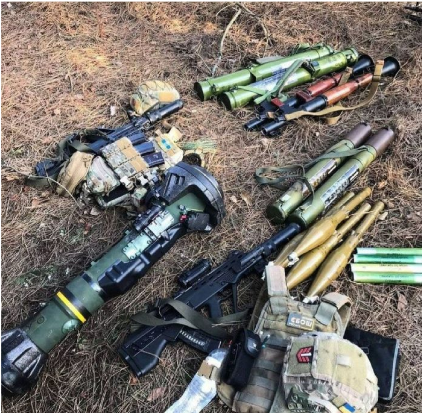
Ukořistěné zbraně na opuštěných pozicích ukrajinské armády

Když Rusko provede invazi na ochranu vlastního etnika, které čelí v sousedním státě 8 let genocidě, tak západ spustí takový řev, jako by ho brali na nože. Že řvou politické loutky americký loutkovodičů, to by mně nepřekvapilo, že ale řvou i obyčejní lidé, to je děsivé. Převýchova českého národa po 30 letech na 1. prioritě přinesla jedovaté a hrozné ovoce. Tohle nejsou Švejci, ne ne. Tohle jsou Goebbelsové, Henleinovci, Freikorps, euro a pro-ami náckové, přepisovači dějin a sundavači soch maršálů – osvoboditelů. A čeští politici, až na výjimky, už raději mlčí. Už totiž mají strach.