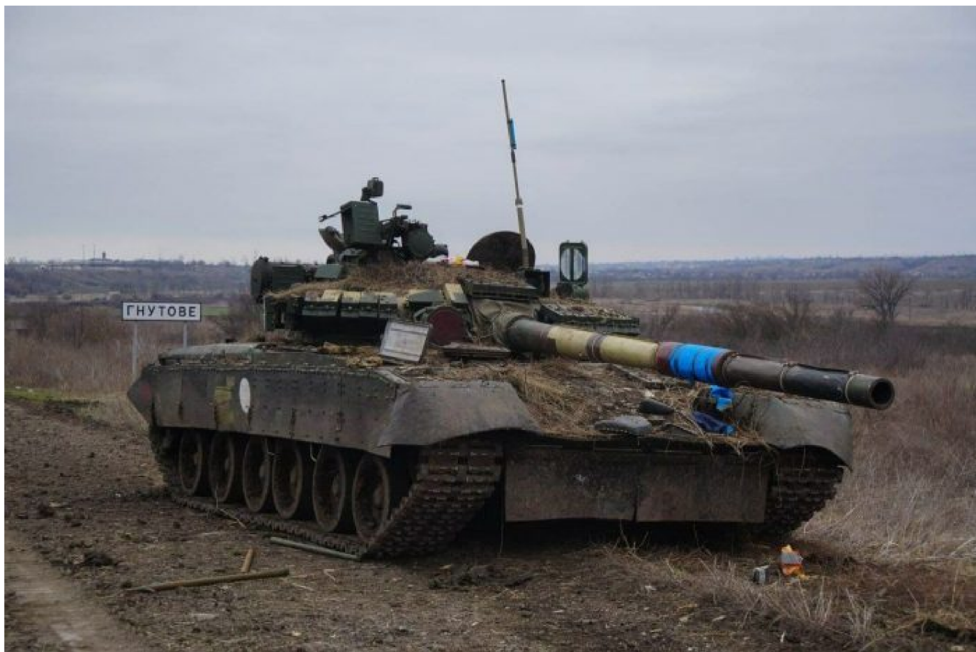
Opuštěný ukrajinský tank nedaleko obce Gnutove

Kyjevskou juntou si vodí Londýnské kanceláře Domu Rothschild a jejich bitevní mopslík s hvězdy a pruhy doslova na provázcích. Cílem je podle Moskvy reset zákonnosti na Ukrajině a návrat demokratických principů zpátky do počátku roku 2014. Ukrajina nesmí být řízena zvenčí a nesmí ohrožovat život, jazyk a svobody národností a etnik na Ukrajině. A toto zkrátka dnešní vláda v Kyjevě akceptovat zjevně nechce. Je otázka, jestli dojde ke změně názoru v Kyjevě, že Ukrajina nebude čistě ukrajinská, ale bude federalizovaná jsou stát několika etnik a kultur. Demokraticky a diplomaticky toho zjevně již dosáhnout nešlo, takže došlo na válečné odstranění hrozby.