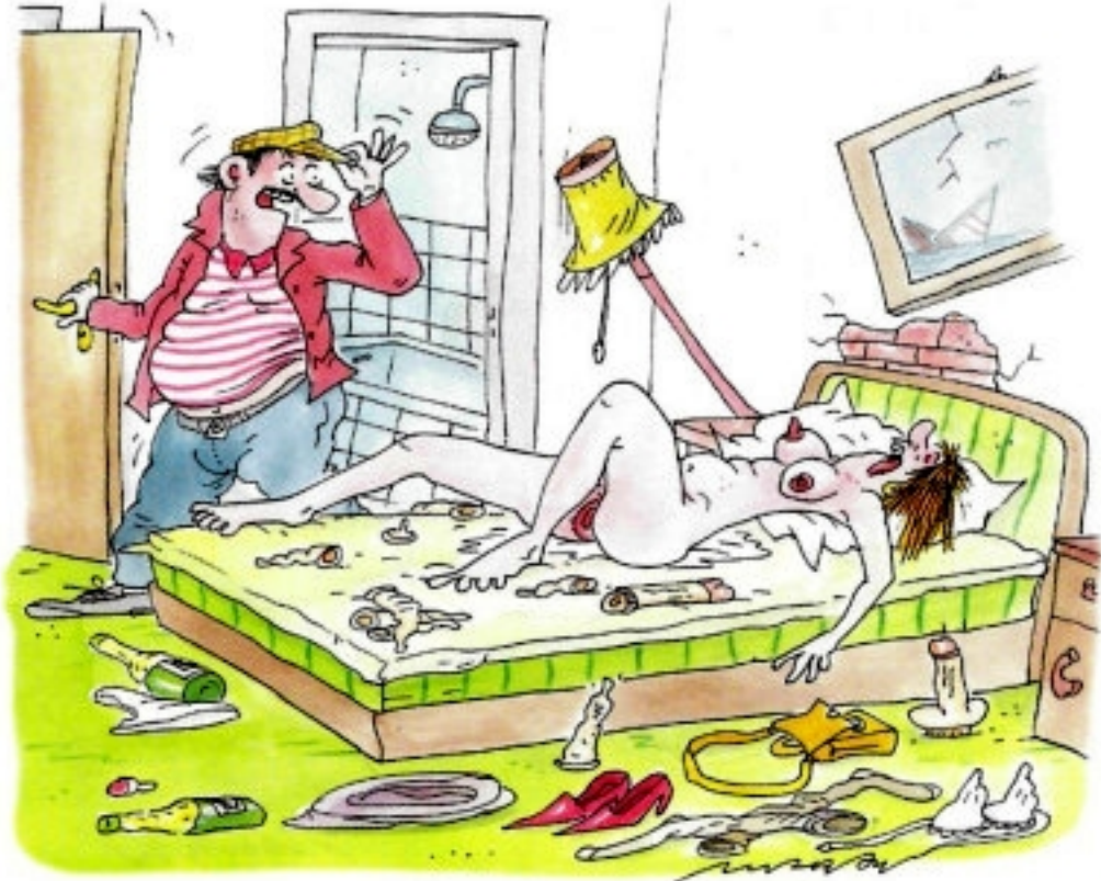
„TAK TO JE DNES ZE SPORTU VŠE ... MĚJTE SE KRÁSNĚ A PŘÍŠTĚ NASHLEDANOU!“