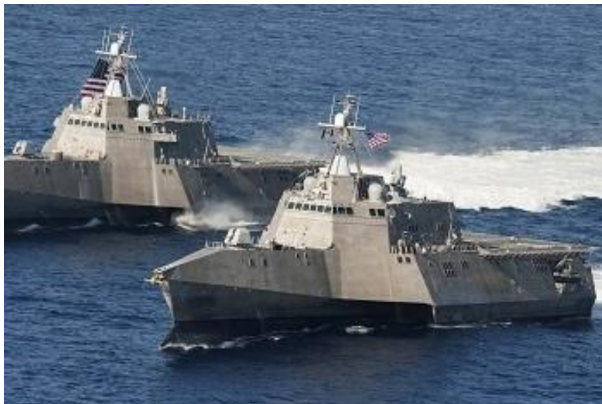
Americké válečné lodě

Na ukrajinském Očakovu, který se nachází v těsné blízkosti Krymu, začala výstavba americké námořní základny, připomíná švýcarské vydání InfoSperber.